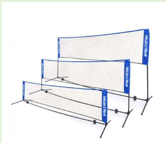
(ilustrativní foto - zdroj internet)