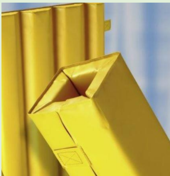
(ilustrativní foto - zdroj internet)