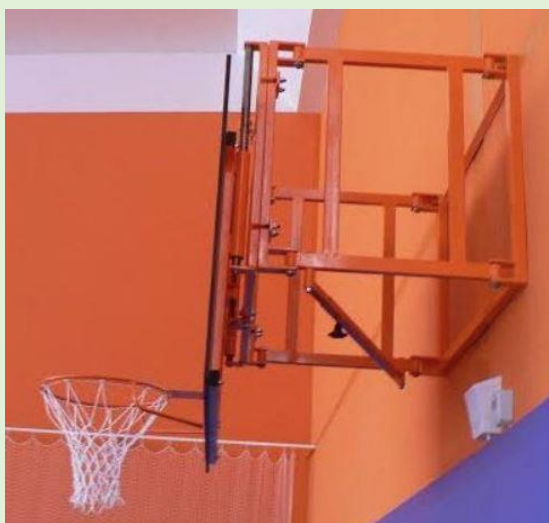
(ilustrativní foto)