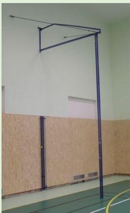
(ilustrativní foto - zdroj internet)