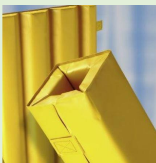
(ilustrativní foto - zdroj internet)